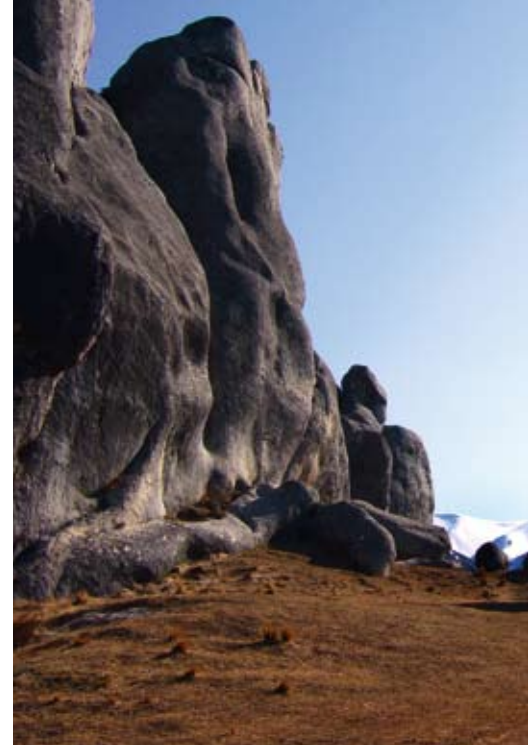
Links: „Sie kamen über fremde Meere“ (Südinsel, Westküste bei Punakaiki). Mitte und Rechts: Te Kohanga, das heilige Lager der Götter.

über fast dreißig Generationen zurück bis zu ihren Ahnen, die vor über 700 Jahren Neuseeland erreichten; einige Waitaha überblicken noch weitaus längere Zeiträume. Aber nicht nur Menschen haben ihr Whakapapa, auch Pflanzen und Tiere, ja selbst die Sterne und die Götter, über deren Whakapapa nur in den Mysterienschulen gesprochen wurde. Und jedes Whakapapa, wenn es vollständig ist, endet, besser: fängt an, urständet in der Schöpfung selbst. Deshalb sind alle Geschöpfe verwandt: Im Anfang rief Io Mata Ngaro, Gott der Götter, Vater und Mutter der Ungeborenen und Schöpfer aller Wesen, das Universum ins Dasein. Und alle die Sternengeborenen waren Brüder und Schwestern, Glieder einer Familie. Hier liegt der eigentliche Grund für die tiefenökologische Lebensweise der Waitaha, die nicht nur aus Klugheit und in Vorsorge für die nachkommenden Generationen die Ressourcen der Natur schonen, sondern aus einem Bewusstsein von Verwandtschaft – „Familienbande“ – sich für die ganze Natur (die „Brüder und Schwestern“ der Schöpfung) verantwortlich fühlen, zu allererst und vor allem aber für unser aller Mutter: Mutter Erde – Papatuanuku .